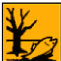
Periculos pentru mediu